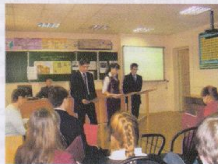
Устный журнал «Российские учёные – лауреаты нобелевской премии»