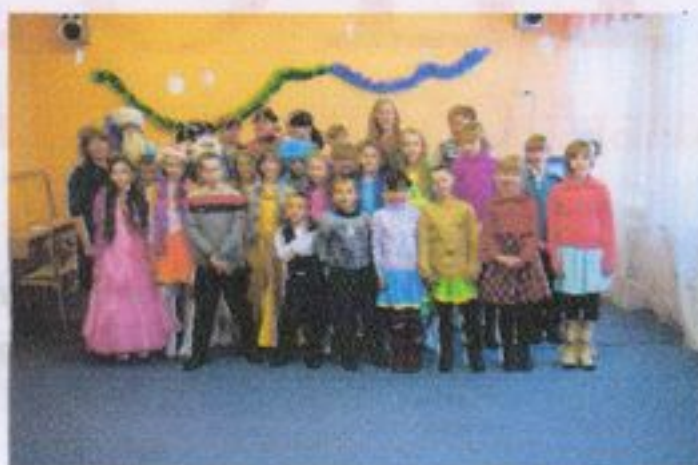
Предновогодняя встреча с детским приютом «Аистенок»